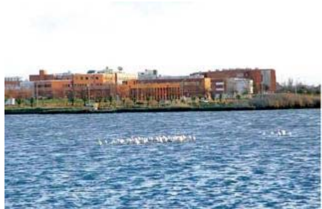
Vista del campus de la Universidade de Aveiro. UA

Por su parte, los grupos de investigación de las universidades de Santiago de Compostela y A Coruña ya se agregaron y están trabajando para desarrollar una estructura similar a la que actualmente funciona en la Universidad de Vigo, para sumarse a un proyecto que aglutinará a 500 doctores en ciencia y tecnología marina, además de expertos de diferentes áreas. Sin embargo, todavía no hay respuesta por parte de la Xunta acerca de la cesión de los terrenos de la ETEA.