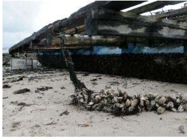
El temporal de mediados de enero causó importantes daños en los cultivos de mejillón en toda la Ría. yaeL d.

Por ahora son sólo datos referidos a los daños producidos en el cultivo de mejillón por lo que faltaría la cuantificación de los importantes desperfectos producidos en estructuras como barcos y lanchas, pero el sector mejillonero maneja ya datos que hablan de entre 12.000 y 15.000 euros de pérdidas por batea en A Illa, debido a los efectos del temporal de viento que azotó Arousa a mediados de enero y que tomó el nombre de “Flora”. Las mismas fuentes indican que en la actualidad, en el municipio habría unas 450 bateas por lo que el cómputo establecería una cifra de pérdidas de molusco de más de 5,8 millones de euros.