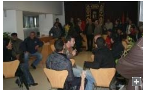
Un centenar de trabajadores de las almadrabas se encerraron en el ayuntamiento.

Las cuatro empresas almadraberas que operan en la provincia de Cádiz se comprometieron ayer en Sevilla ante la directora general de Pesca, Margarita Pérez, y el director general de Ordenación Pesquera, Ignacio Gandarias, al inicio de las contrataciones de los marineros para la campaña del atún de este año, aunque la validez de los contratos quedará supeditada a la obtención de una mayor cuota pesquera que la que en principio ha correspondido al sector y que alcanza las 667 toneladas.