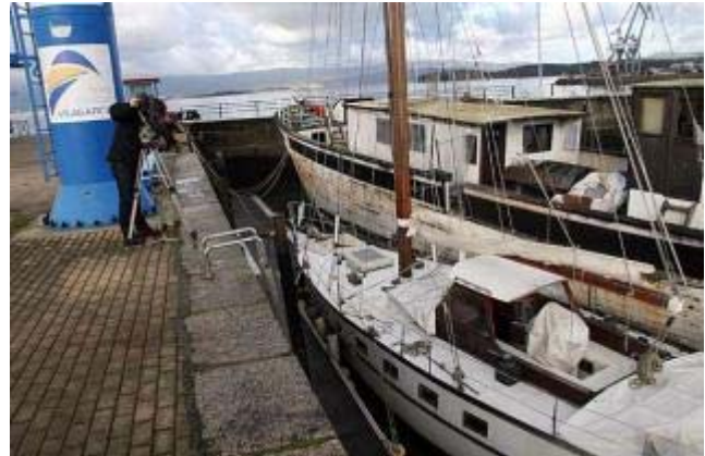
El "Carmen Barcia" sufrió graves desperfectos en el último temporal que azotó Arousa. J.L.Oubiña

El Puerto de Vilagarcía se ha convertido, para muchos, en el cementerio arouzano de las embarcaciones más emblemáticas. Si el narcobuque Abrente, que será subastado la próxima semana, ha marcado ya un antes y un después en la conservación de las naves, ahora es el Carmen Barcia el que motiva la preocupación de amantes de la cultura marítima que se han echado a las ondas digitales reclamando un trato justo para un buque construido a mediados de los 50 en un astillero noíés. Un nombre más a añadir a la lista de asuntos a resolver.